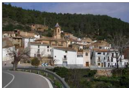
Alcudia de Veo elige a su alcalde tirando una moneda al aire.

El PSPV-PSOE ha obtenido la Alcaldía de la localidad castellanense de Alcudia de Veo gracias a la suerte, ya que una ficha de color ha decidido qué partido gobernará el municipio durante los próximos cuatro años al producirse en los comicios del pasado domingo un empate técnico entre las candidaturas socialistas y 'populares'.